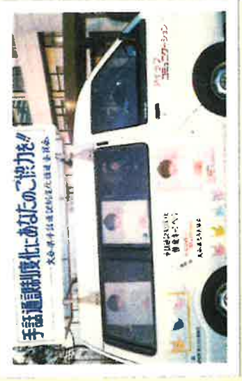
S61.アイラブ県内普及キャラバン。