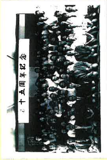
協会創立15周年記念式。