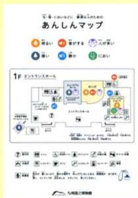
あんしんマップ QRコードはこちら

音や光、においなどに敏感な方に安心して過ごしていただくための「あんしんマップ」と、はじめて九州国立博物館に行く人が事前に博物館のことを知ることができる「あんしんガイド」ができました。「同伴者用 あんしんガイド」もあります。当館ホームページで見ることができます。