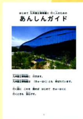
あんしんガイド QRコードはこちら