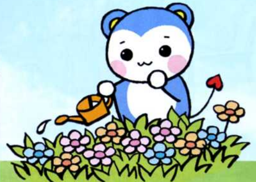
人権の約束事運動 マスコットキャラクターモモマルくん